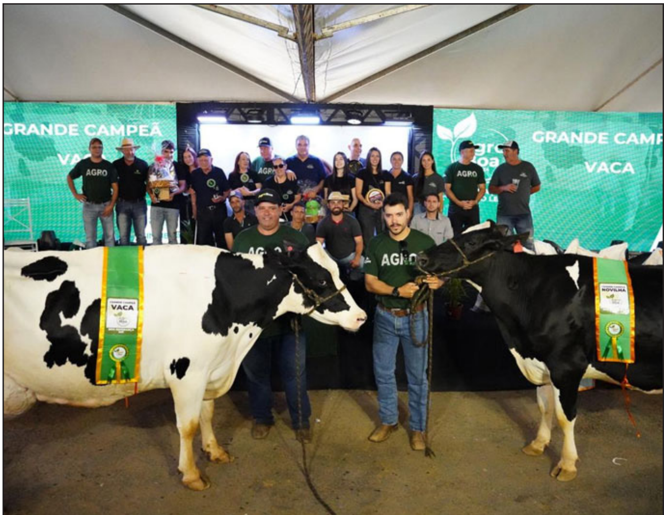
A Grande Campeã Vaca Adulta e a Grande Campeã Novilha

CA: Queremos continuar crescendo e para isso contamos com os nossos parceiros e colaboradores. Vamos sempre incentivar as melhorias nas estruturas para um conforto maior do nosso rebanho. Nunca podemos parar.